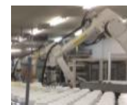
箱詰めラインの改良