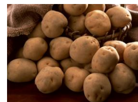
原料切替に伴う経費の一部負担