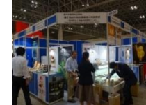
見本市でのPRの様子