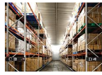
共同化設備の整備