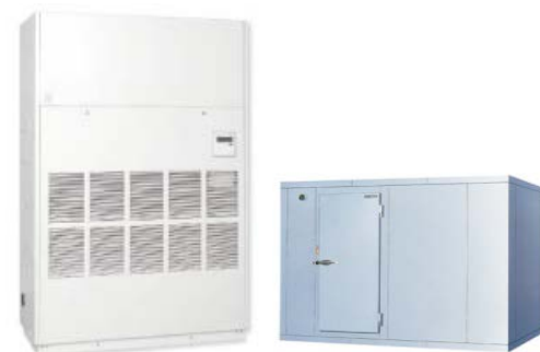
温度管理を要する装置・設備の導入