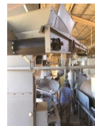
有機食品の製造ライン（茶葉→荒茶への製造ライン）