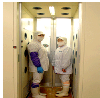
エアシャワー等の衛生管理設備の導入