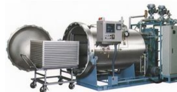
有害な微生物が産生する毒素を安全なレベルまで取り除く殺菌機の導入